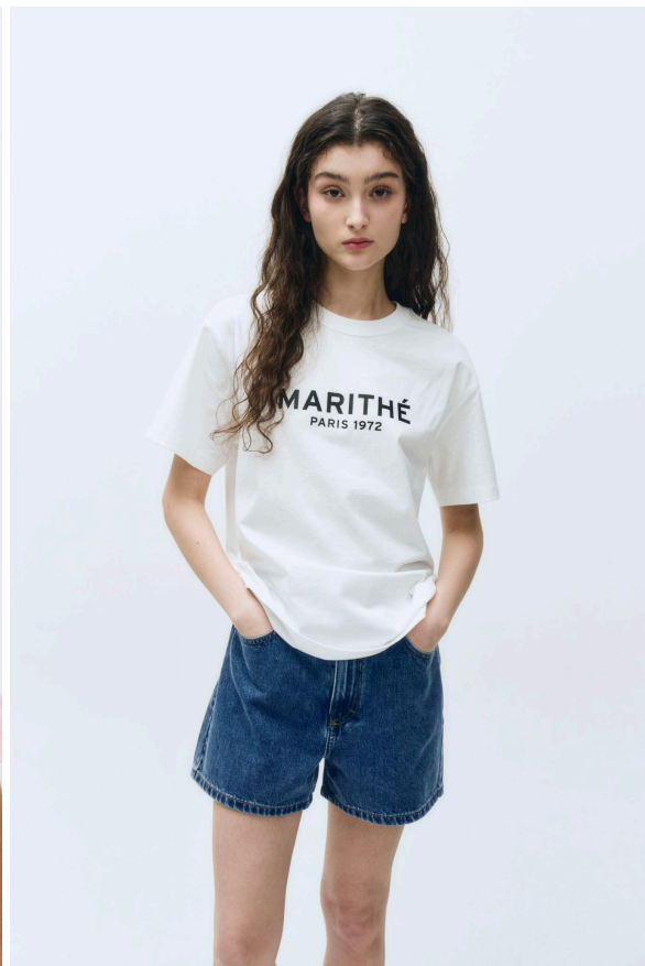
*25SS人気商品：W REGULAR LOGO TEE (BLUE/WHITE/PINK)