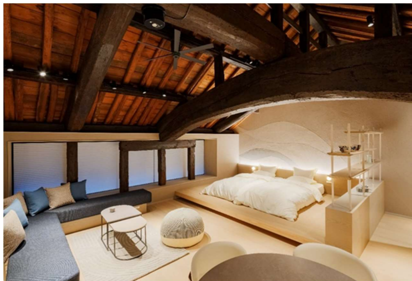
「The 曜 Terrace」ベッドルーム

*アルベルゴ・ディフーズタウンとはイタリア語で、アルベルゴは「宿」、ディフーズは「分散した」を意味しており宿泊施設を分散した街となります。