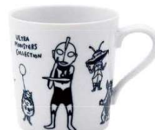
オールスター軽量マグカップ 340ml ¥750 (税込 ¥825)

※画像はイメージです。 ※アレルギーをお持ちのお客様はスタッフまでお尋ねください。 ©TSUBURAYA PROD. Designed by Shinzi Katoh