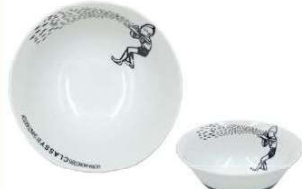
ウルトラモンスターズ CLASSY 軽量ラーメン鉢 (ウルトラマン) ¥750 (税込 ¥825)