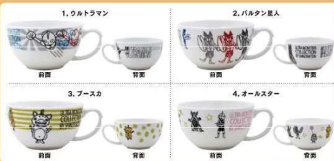
ウルトラモンスターズ 370ml 軽量スープカップ (ウルトラマン / バルタン星人 / フースカ / オールスター) ¥750 (税込 ¥825)