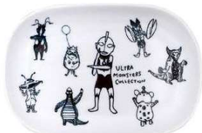
楕円皿 オールスター ¥750 (税込 ¥825)