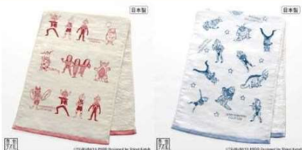
ウルトラモンスターズジェネレーションズ フェイスタオル (ルビーレッド / ウルトラマリン) ¥750 (税込 ¥825)