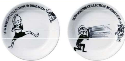
ウルトラモンスターズ 軽量 21.5cm カレー皿 (ウルトラマン / ウルトラセブン) ¥750 (税込 ¥825)