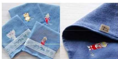
ぶちウルタオルチーフ (ウルトラマン / バルタン星人 / フースカ / ウルトラセブン) ¥750 (税込 ¥825)